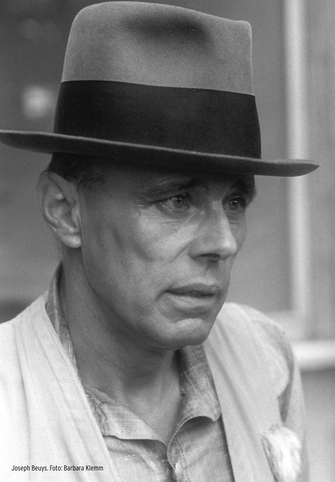
Joseph Beuys.