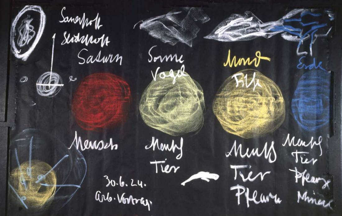
(oben) Rudolf Steiner: Tafelzeichnung zum Vortrag vom 30. Juni 1924 (GA 354) (links unten)