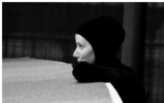
Während den Proben zu Ahrimans Reich aus „Der Hüter der Schwelle“ von Rudolf Steiner.

Att eurytmin röner föga erkännande inom det allmänna kulturlivet hör till dess väsen, sannolikt i högre utsträckning än man tror. I varje fall är det viktigt att den kunnat skapa sig ett självständigt andligt fundament utöver instiftandet genom Rudolf Steiner. Det är en uppgift som talgestaltningen och det antroposofiskt inspirerade skådespelet ännu har framför sig. Yrkesmöjligheterna