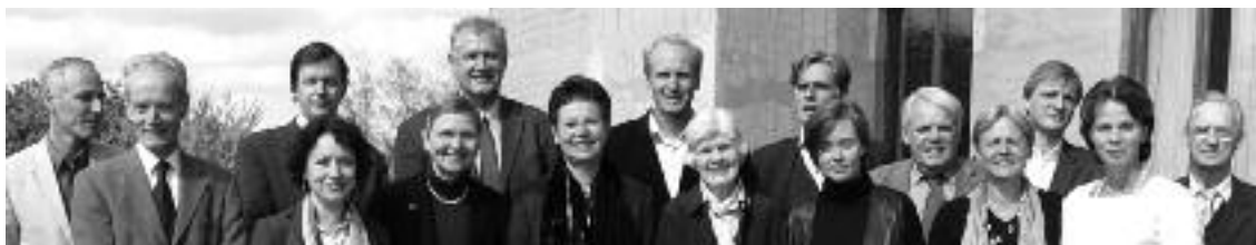
Das Hochschulkollegium am Goetheanum

– Glimtar från den antroposofiska verksamheten vid Goetheanum –