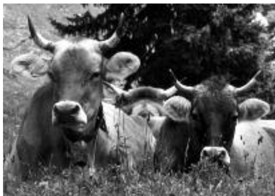
Erkennungszeichen der Biologisch-Dynamischen Landbaus: Kühe mit Hörner

I mars 2007 började sektionens medarbetare åter sin verksamhet i det nyrenoverade "glashuset". Flytten från trånga kontor till generösa och ljusa rum illustrerar sektionens utveckling. Det politiska arbetet för ekologiskt lantbruk i Bryssel, rådgivning kring etiska frågor som växtens värdighet, dialoger med högskolor, forskningsfrågor om företagshygien – sektionen står sedan länge med ena benet i den breda offentligheten och med andra benet i antroposofin.