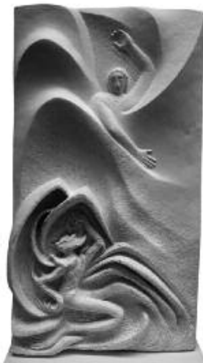
Mikael-Ahriman-imagination. Ursula Gruber 2007

Mer direkt än denna rapport kommer utställningen under hösten 2008 att kunna ge information om sektionens arbete. Samtidigt med Mikaelikonferensen bjuds talrika konstnärer att visa tavlor och skulpturer om "Mikael som tidsande" i Goetheanum.