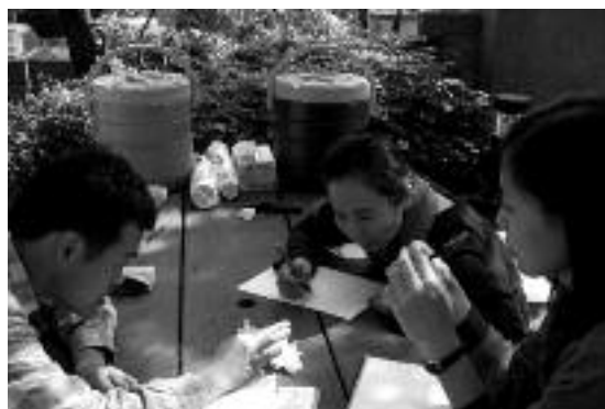
Studenter vid waldorfseminariet i Taiwan.

Att man lyckas fördjupa sina djupa spirituella rötter. Och där kan antroposofin utgöra en viktig hjälp.