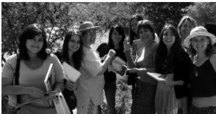
Utbildningskurs i antroposofisk medicin i Chile.