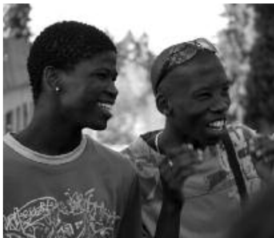
Två elever från Sydafrika under Connectmötet

Mest liv utvecklades i samband med de tre Connectkonferenserna under några av de senaste åren. Ungefär 30 tolfteklasser från 20 länder bjuds till Goetheanum för att erbjuda ett första möte med antroposofin. Några elever från den första konferensen 2003 står nu som ansvariga med egna antroposofiska projekt, som till exempel IDEM, ett fritt nätverk för internationella insatser på utvecklingsområdet. Den tredje Connectkonferensen 2007 skulle varit den sista, men förväntningarna hos somliga elever ur olika elfteklasser tvingar sektionens medarbetare kring Elizabeth Wirsching att gå vidare och på nytt öppna portarna 2009. Den senaste konferensens erfarenheter visar att den innehållsmäs-