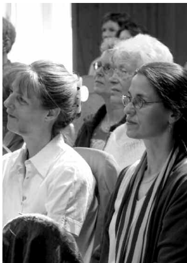
Till fysioterapeuternas årsmöte inbjöds också andra spirituellt orienterade inriktningar.

Därför är det särskilt betydelsefullt att Koliskomötet i Frankrike äger rum hos Unesco.