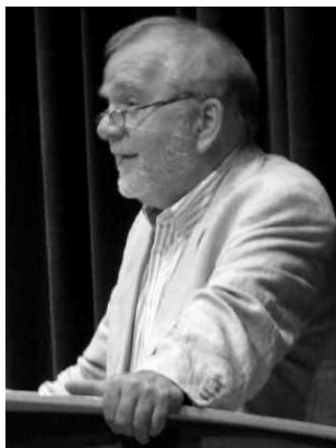
Författaren och filosofen Rüdiger Safranski talar om Schillers inre religion.

I början av det här året kom andra årsboken som ges ut av