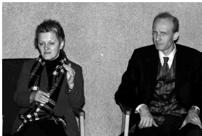
”Ingå allianser med kända och okända vänner”, rekommenderade den tyska politiker Renate Künast und lantbrukskonferensen.