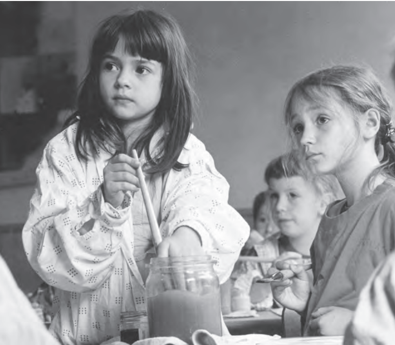
Waldorfpädagogik: ein Blick in die Zukunft