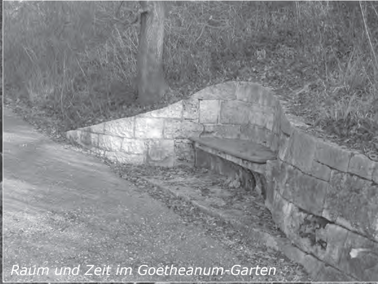
Raum und Zeit im Goetheanum-Garten