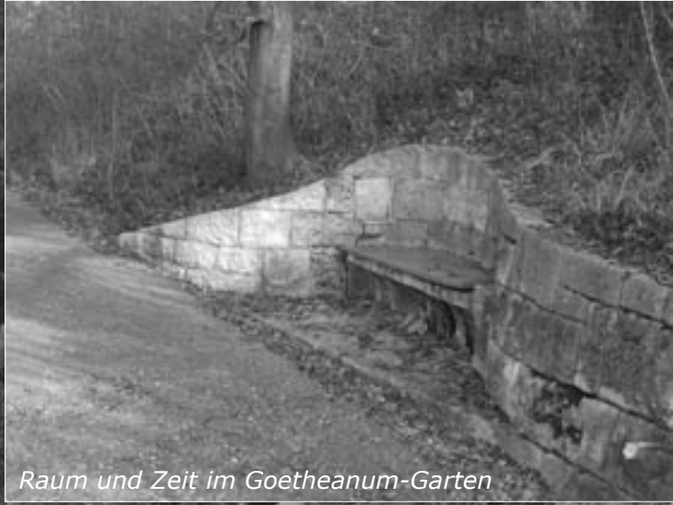
Raum und Zeit im Goetheanum-Garten