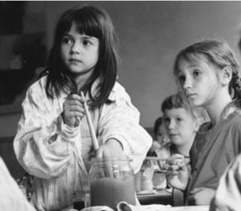
Waldorfpädagogik: ein Blick in die Zukunft