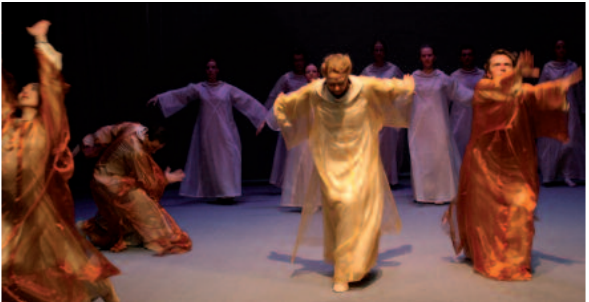
„Sieben Worte“ – Eurythmie-Aufführung der Goetheanum-Bühne.

„Wenn man Eurythmie sieht, sieht der eine nur sich bewegende Arme, der andere die Sprache der Engel. Beides stimmt so nicht ganz. Geist und Materie fallen auseinander. Aber wir können die Trennung aufheben – aktiv. Das ist die Kunst, dass konkret wird, was ich nicht sehe und was doch ständig wirkt.“