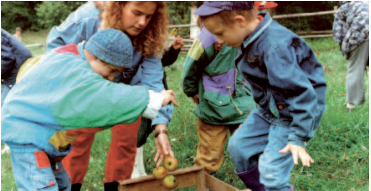
Die Apfelernte wird in einer anthroposophisch-heilpädagogischen Institution zu einer Physikstunde.

„Unser Leben, die Erde tatsächlich menschengemäss zu entwickeln, bedeutet, alle Winkel unserer Existenz in ihrer geistigen Herausforderung begreifen zu lernen. Mich begeistert deshalb an Anthroposophie jeden Tag neu, dass sie uns Wege aufzeigt, selbst so vom Nutzen bestimmte Lebensbereiche wie das Bank- und Finanzwesen spirituell zu durchdringen. So bilden sich tragfähige Perspektiven eines auf Brüderlichkeit gegründeten Finanzwesens.“