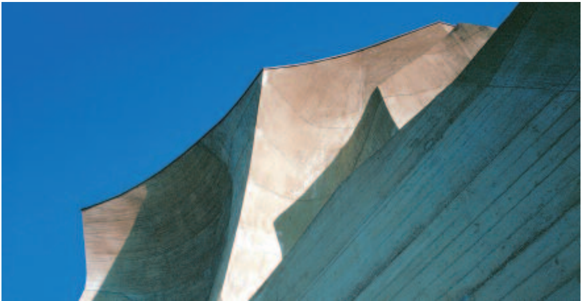
Detail der Fassade des Goetheanum, Sitz der Allgemeinen Anthroposophischen Gesellschaft.